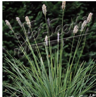
セスレリア アルゲンティア 学名: Sesleria autumnalis ssp. argentea

科:イネ科 原産地:北アメリカ 開花期: 植栽場所:フラワーアイランド、アニーカの庭