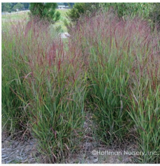
パニクム ビルガツム 'シェナンドー' 学名: Panicum virgatum 'Shenandoah'