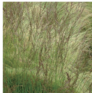
モリニア 'エディスダッチェス' 学名: Molinia caerulea 'Edith Dudsus'