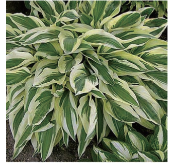
ホスタ 'レイクサイドドラゴンフライ' 学名: Hosta 'Lakeside Dragonfly'