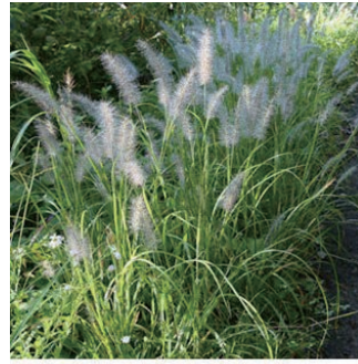
ペニセツム アロペクロイデス 学名: Pennisetum alopecuroides

科:イネ科 原産地:ヨーロッパ 開花期: 植栽場所:フラワーアイランド、アルフレスコ