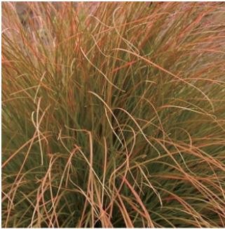
カレックス テスタセア 学名: Carex testacea

科:イネ科 原産地:東アジア 開花期: 植栽場所:フラワーアイランド、アニーカの庭