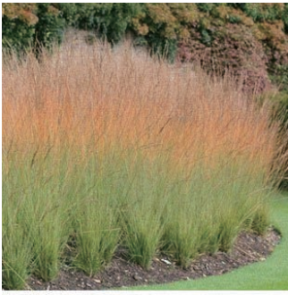
モリニア 'ハイデブラウト' 学名: Molinia caerulea 'Heidebraut'

科:イネ科 原産地:ヨーロッパ、西アジア 開花期: 植栽場所:フラワーアイランド