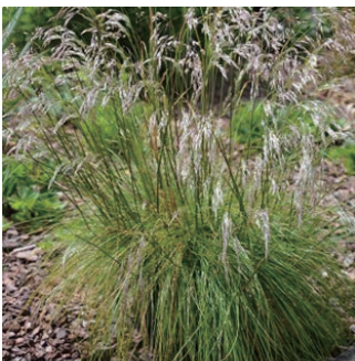
デスカムプシア フレクスオサ 学名: Deschampsia flexuosa

科:イネ科 原産地:北アメリカ 開花期: 植栽場所:フラワーアイランド、ローズガーデン