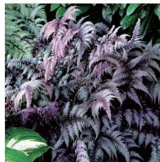
ニシキシダ 'バーガンディレース' 学名: Athyrium niponicum 'Burgundy Lace'