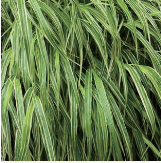
斑入りフウチソウ 学名: Hakonechloa macra 'Variegata'