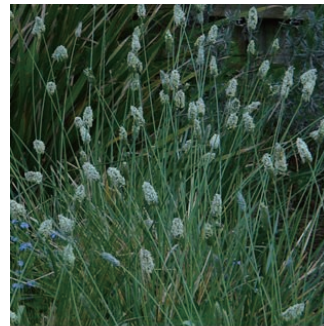
セスレリア ニチダ 学名: Sesleria nitida