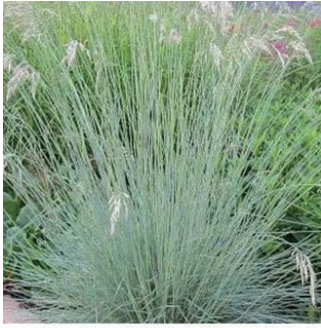
ヘリクトトリコン 学名: Helictotrichon sempervirens

科:イネ科 原産地:ユーラシア 開花期: 植栽場所:アルフレスコ、フラワーアイランド