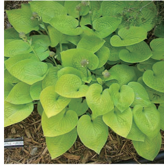
ホスタ 'リトルオーロラ' 学名: Hosta 'Little Aurora'