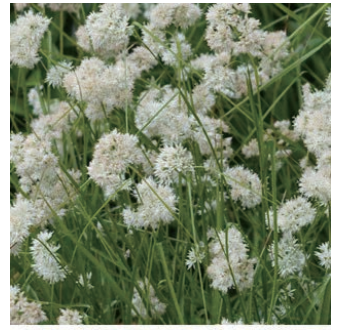
ルズラ ニベア 学名: Luzula nivea

科:イネ科 原産地:ヨーロッパ、西アジア 開花期: 植栽場所:フラワーアイランド