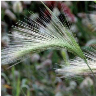
ホルデウム 学名: Hordeum jubatum