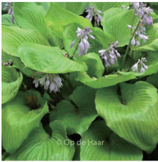
ホスタ 'サムアンドサブスタンス' 学名: Hosta 'Sum and Substance'