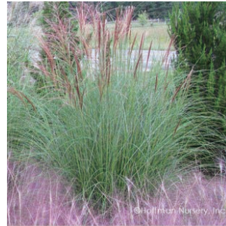
ミスカンサス シネンシス 'グラキリムス' 学名: Miscanthus sinensis 'Gracillimus'