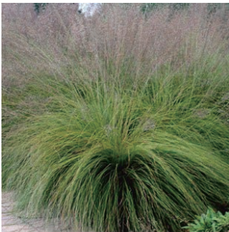
スポロボルス ヘテロレピス 学名: Sporobolus heterolepis

科:イネ科 原産地:北アメリカ 開花期: 植栽場所:フラワーアイランド、アニーカの庭