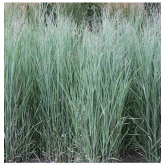
パニクム ビルガツム 'ヘビーメタル' 学名: Panicum virgatum 'Heavy Metal'