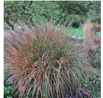
ミスカンサス シネンシス 'パープルフォール' 学名: Miscanthus sinensis 'Purple Fall'