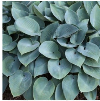
ホスタ 'ハルシオン' 学名: Hosta 'Halcyon'