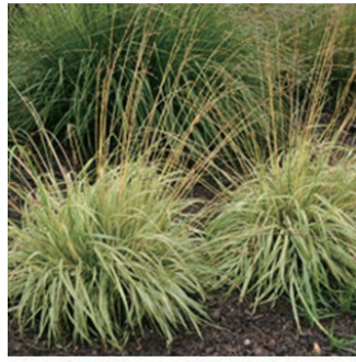
モリニア 'バリエガタ' 学名: Molinia caerulea 'Variegata'

科:イネ科 原産地:ヨーロッパ、西アジア 開花期: 植栽場所:フラワーアイランド