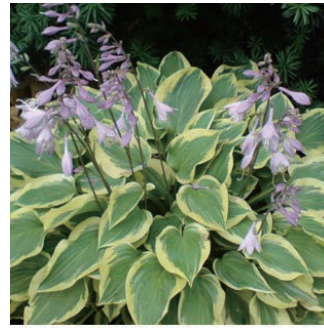
ホスタ 'ピルグリム' 学名: Hosta 'Pilgrim'