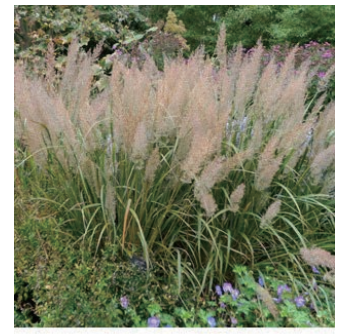
カラマグロステス ブラキトリカ 学名: Calamagrostis brachytricha

科:イネ科 原産地:東アジア 開花期: 植栽場所:フラワーアイランド、アルフレスコ