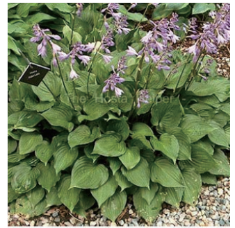
ホスタ 'パールレイク' 学名: Hosta sieboldii 'Pearl Lake'