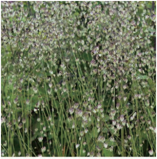
ブリザ メディア 学名: Briza media

科:イネ科 原産地:ヨーロッパ 開花期: 植栽場所:フラワーアイランド、アルフレスコ