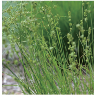
カレックス ロゼア 学名: Carex rosea

科:カヤツリグサ科 原産地:南アメリカ 開花期: 植栽場所:エントランス、ニワカラ前