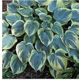
ホスタ 'アリストクラット' 学名: Hosta 'Aristocrat'