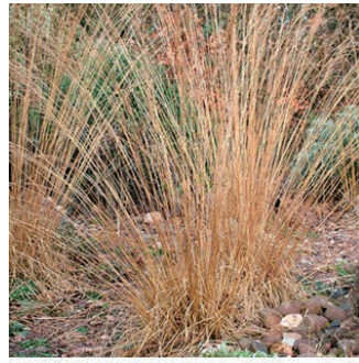
モリニア 'モアヘクゼ' 学名: Molinia caerulea subsp. caerulea 'Moorhex'

科:イネ科 原産地:ヨーロッパ、西アジア 開花期: 植栽場所:フラワーアイランド