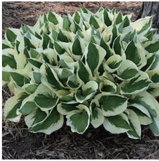
ホスタ 'パトリオット' 学名: Hosta 'Patriot'