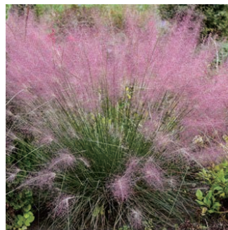
ミュレンベルギア 'アンダウンテッド' 学名: Muhlenbergia reverchonii 'Undaunted'