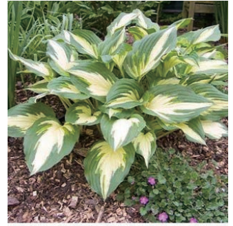
ホスタ 'クリスマスキャンディ' 学名: Hosta 'Christmas Candy'