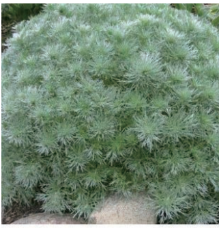
アルテミシア シュミツディアーナ 'ナナ' 学名: Artemisia schmidiana 'Nana'