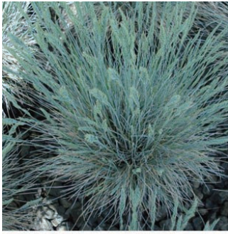
フェスツーカ 'ボルダーブルー' 学名: Festuca glauca 'Boulder Blue'