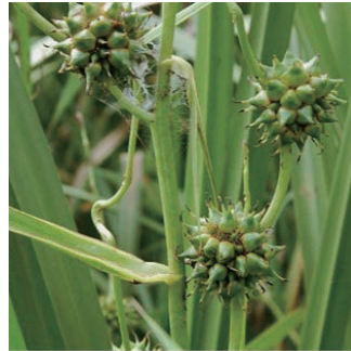
ミクリ 学名: Sparganium erectum