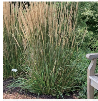
カラマグロステス 'カールフォースター' 学名: Calamagrostis acutiflora 'Karl Foerster'

科:イネ科 原産地:東アジア 開花期: 植栽場所:フラワーアイランド、アルフレスコ