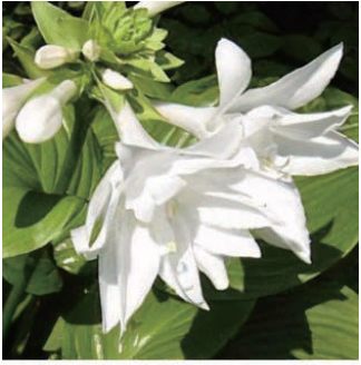
ホスタ 'アフロディーテ' 学名: Hosta plantaginea 'Aphrodite'

科:イネ科 原産地:ユーラシア 開花期: 植栽場所:アルフレスコ、フラワーアイランド