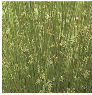
イグサ 学名: Juncus effusus