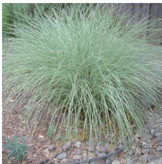
ミスカンサス シネンシス 'モーニングライト' 学名: Miscanthus sinensis 'Morning Light'