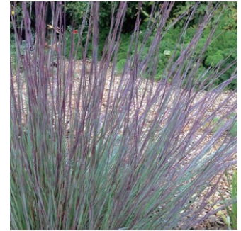
スキザクリウム 'プレーリーブルース' 学名: Schizachyrium scoparium 'Prairie Blues'