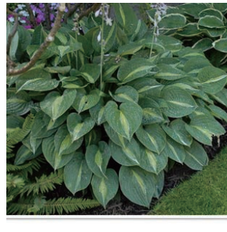
ホスタ 'ストリプテーズ' 学名: Hosta 'Stripease'