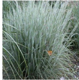
スキザクリウム 'ハハトンガ' 学名: Schizachyrium scoparium 'Ha Ha Tonka'

科:カヤツリグサ科 原産地:南アメリカ 開花期: 植栽場所:エントランス、ニワカラ前