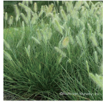
ペニセツム 'ハメルン' 学名: Pennisetum alopecuroides 'Hamelii'