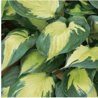
ホスタ 'モーニングスター' 学名: Hosta 'Morning Star'