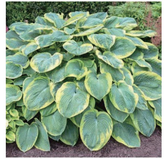
ホスタ 'フランシスウィリアムス' 学名: Hosta 'Frances Williams'