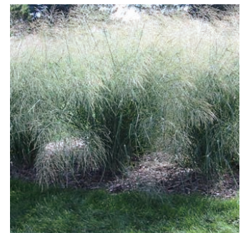
パニカム ビルガツム 'クラウドナイン' 学名: Panicum virgatum 'Cloud Nine'