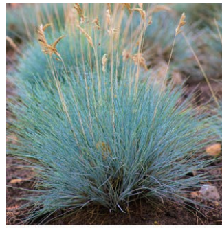
フェスツーカ 'エリジャーブルー' 学名: Festuca glauca 'Elijah Blue'