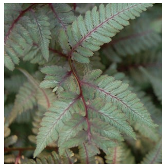
ニシキシダ 学名: Athyrium niponicum