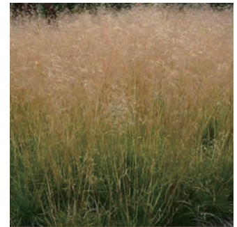
デスカムプシア 'ゴールドタウ' 学名: Deschampsia cespitosa 'Goldtau'

科:イネ科 原産地:北アメリカ 開花期: 植栽場所:フラワーアイランド、ローズガーデン