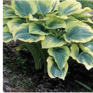
ホスタ 'リバティー' 学名: Hosta fluctuans 'Liberty'