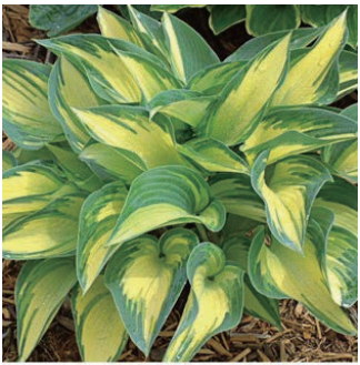
ホスタ 'ジューン' 学名: Hosta 'June'