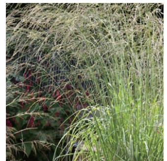
モリニア 'トランスペアレント' 学名: Molinia caerulea ssp. arundinacea 'Transparent'